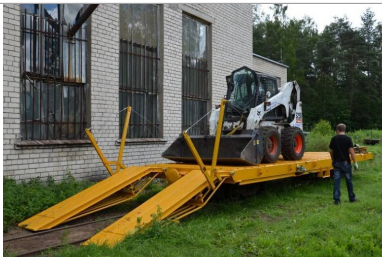
2. attēls. Sliežu ceļu mašīnas (platformrampas) izmēģināšana ar mini iekrāvēju 2016. gada jūlijā