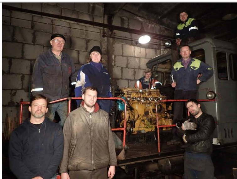
6. attēls. Lokotraktora ESU1A-481 apkopes talka 2016. gada 26. novembrī