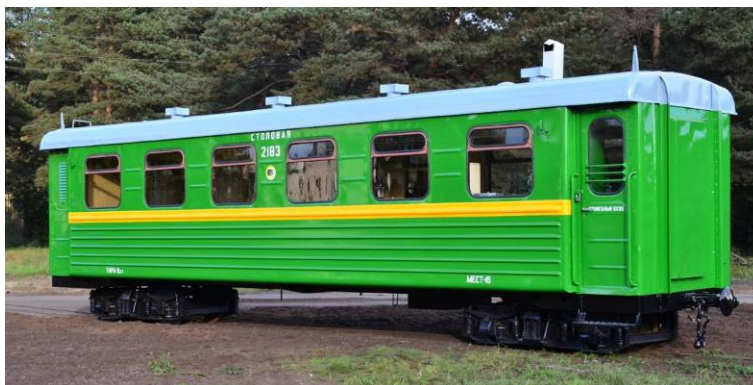
4. attēls. Ēdnīcas vagona eksterjers pēc restaurācijas (2016. gada septembris)

Paralēli tika veikti arī nelieli motordrezīnas restaurācijas darbi, jo kopš motordrezīnas restaurācijas 2008. gadā jau bija pagājuši 8 gadi un tās dzinējam bija nepieciešams vidēja apjoma kapitālais remonts, kura laikā tika nomainīti aizdedzes mezgli, ģenerators, sprieguma regulators, virzuļi un gredzeni, kā arī izslīpēti cilindri, veikts ātrumkārbas kapitālais remonts un sajūga izspiedējgultņa nomaiņa.