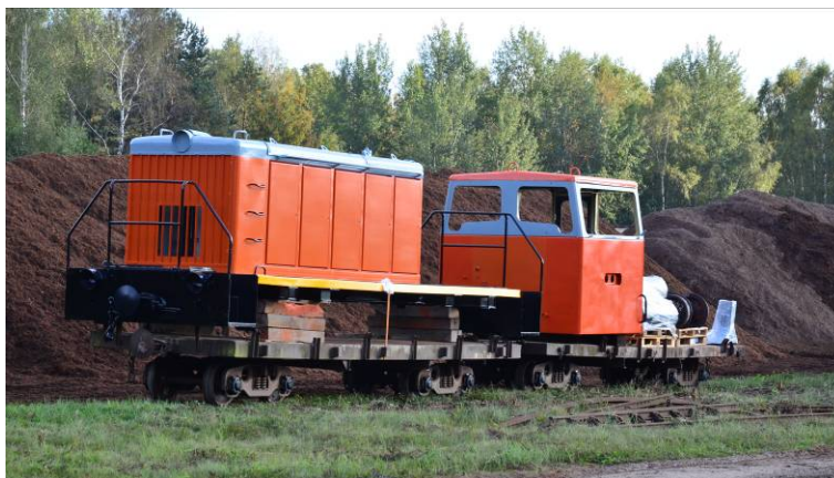
3. attēls. Lokomotīves TU6A-1885 virsbūve pēc remonta, pagaidu veidā novietota uz platformām (2016. gada septembris)

Pārskata gadā tika turpināti iesāktie dīzeļlokomotīves TU6A-1885 remontdarbi, ņemot vērā šīs lokomotīves vēsturisko vērtību – tā ir Baložu dzelzceļā vēsturiski ekspluatēta lokomotīve, kurai pēc atjaunošanas būs galvenā loma visu pārvadājumu veikšanai. Lokomotīvei turpinājās darbi pie ritošās daļas remonta, salikšanai sagatavotas visas atsperojuma detaļas un reaktīvie vilktņi, turpinās ratiņu rāmju remonts, kā arī pabeigti apjomīgi virsbūves remonta un pārkrāsošanas darbi, kuru laikā virsbūvei tika novērsti daudzi lielāki un mazāki bojājumi, kas tai bija radušies savā agrākajā ekspluatācijā.