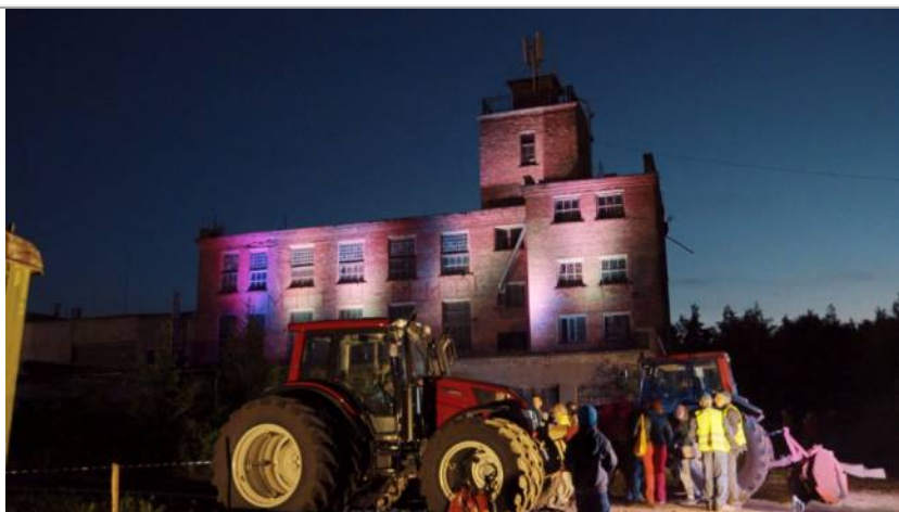
8. attēls. Kūdras tehnikas demonstrējums uz bijušās kūdras izolācijas plātņu fabrikas fona Muzeju naktī 2017. gada 21. maijā