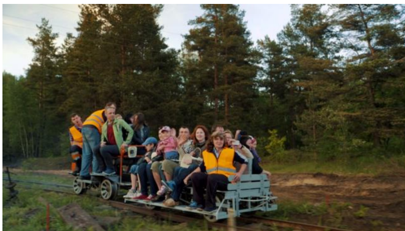
7. attēls. Izbrauciens ar motordrezīnu Muzeju naktī 2017. gada 21. maijā

Lai gan Baložu kūdras muzejdzelzceļš vēl nav gatavs un vēl veicams liels darbs, pirms tas pilnvērtīgi varēs uzņemt apmeklētājus, taču lai dotu iespēju ielūkoties tajā, kā pamazām top šis objekts, biedrība organizēja pirmo publisko pasākumu – starptautisko Muzeju nakts pasākumu ietvaros 21.05.2016, ar devīzi „Durvis uz kūdras ieguves pasauli”. Pasākuma laikā apmeklētāji devās izbraucienā ar šaursliežu motordrezīnu un lokotraktoru no Baložu pilsētas un kūdras fabriku, kur tās krautuvē bija iespēja aplūkot un izložņāt izvietoto kūdras ieguves tehniku un šaursliežu ritekļus, īpaši ēdnīcas vagonu. Neskatoties uz minimālo reklāmu, pasākums ieguva milzīgu atsaucību, laika posmā no 19:00 līdz 01:00 to apmeklēja 1000 cilvēku!