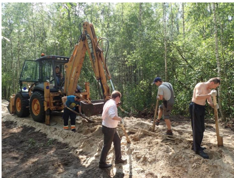
1. attēls. Sliežu ceļu remontdarbi (pacelšana uz jauna balasta bij. 2. ieplakā)